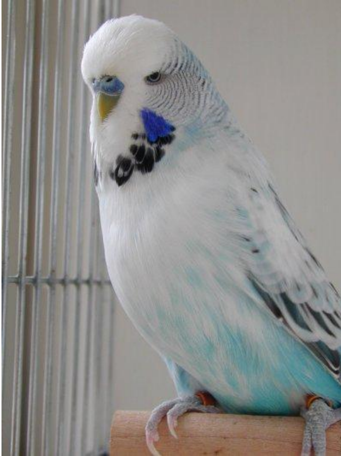
Frosted pied série bleue